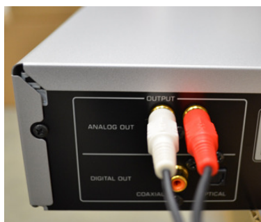
Bild 2 visar anslutning av CD-spelare på förstärkarens baksida.

Bild 1 visar inkoppling på baksidan av CD-spelaren (typ Yamaha CD-S300).